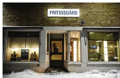
Insändarskribenten tycker det är fel att fritidsgårdarna i Gullänget och Domsjö ska stängas.

Förstår inte hur man tänkte när beslutet togs, inte på