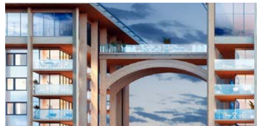
Materialval: Trä, glas och metall i samklang med omgivande natur och byggnader.