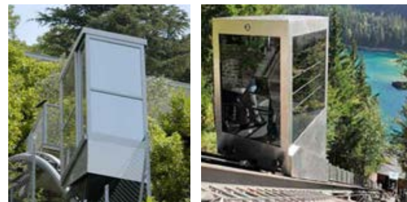
Bergshiss som länkar samman stadskärnan med Varvsbergets topp