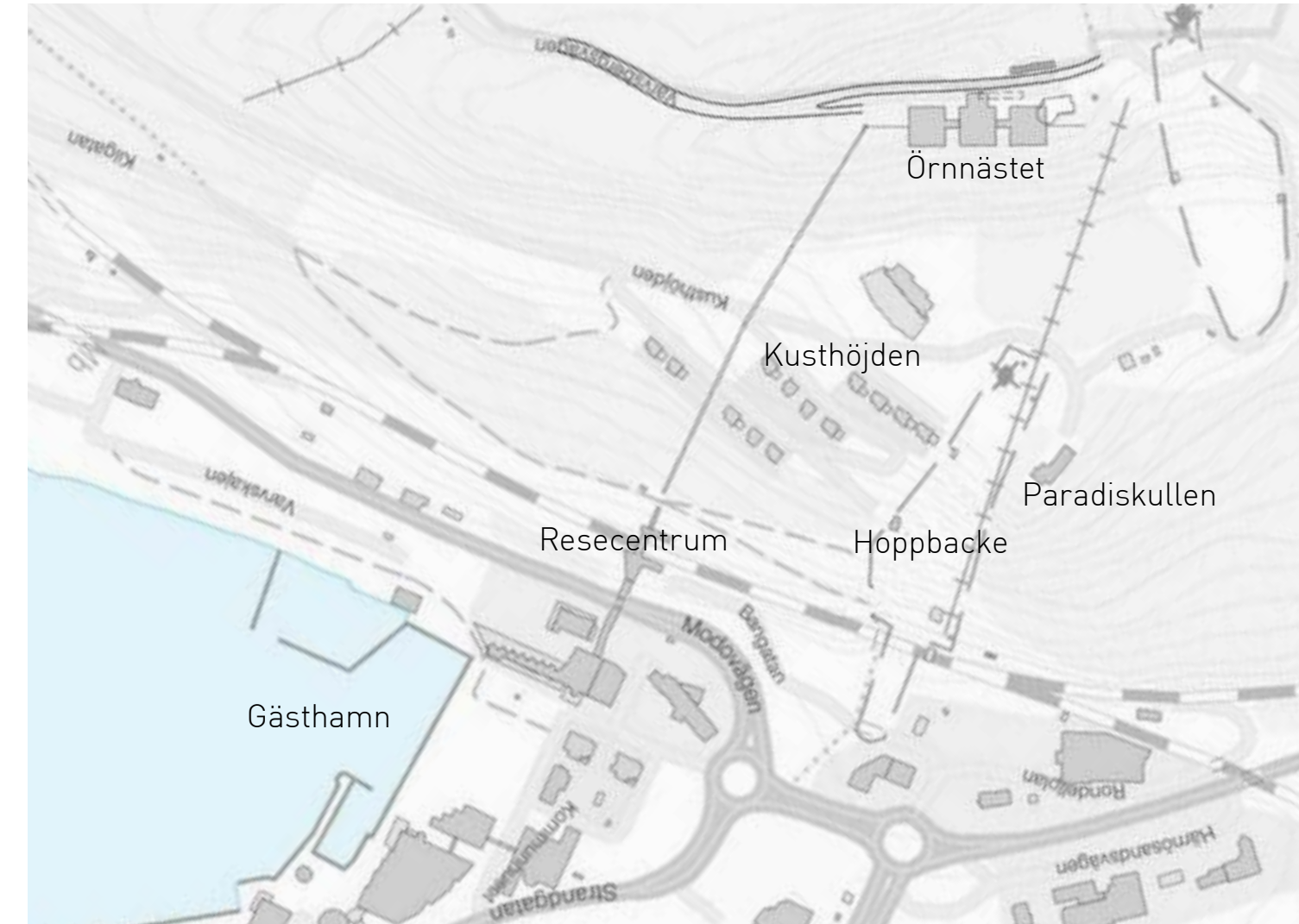
Situationsplan Skala 1:5.000 (Halvskala A3, 1:10.000)

Till projektet knyts en berghiss som länkar samman stadskärnan med Varvsbergets topp via resecentrum och Kusthöjden. Här placeras även en utsiktsplats för allmänheten. En restaurang placeras på takvåningen och förses med såväl öppna terrasser som en takad terrass med kvällssol. Till restaurangen tar man sig via en glasad hiss i riktning mot Hörnsjön.