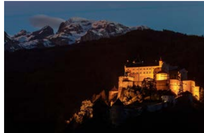
Slottet Hohenwerfen i kontrast till naturens egna örnbö.

Träformationer och färgval harmonierar med den omgivande naturen och de omkringliggande byggnaderna samtidigt som formspråket och den eleganta fasaden av vitt glas bryter ifrån och skapar en ljus och på kvällen upplyst fond på Varvsbergets topp.