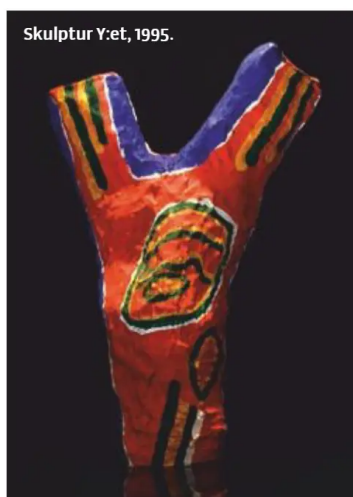
Skulptur Y:et, 1995.

Av GABRIELLA KVARNLÖF