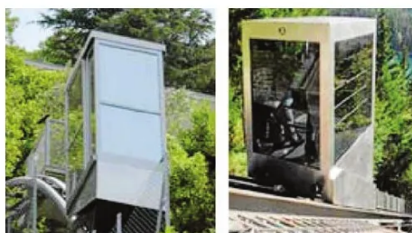
Ingen snedhiss, men nu kommer den snart – bergsbanan.