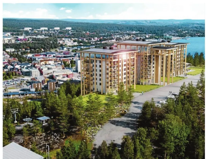
Högst uppe på Varvsberget planeras 99 lägenheter i tre huskroppar.