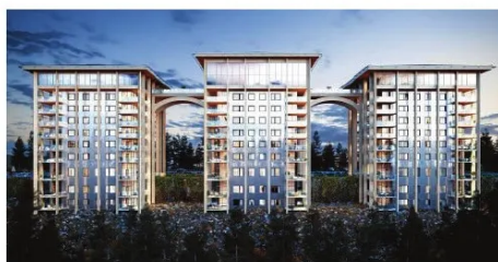
Som ett upplyst smycke ska Örnnästet vara om kvällarna.

Den nya loggan som snabbt togs fram i går.