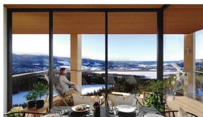
Husen får utsikt åt alla håll.