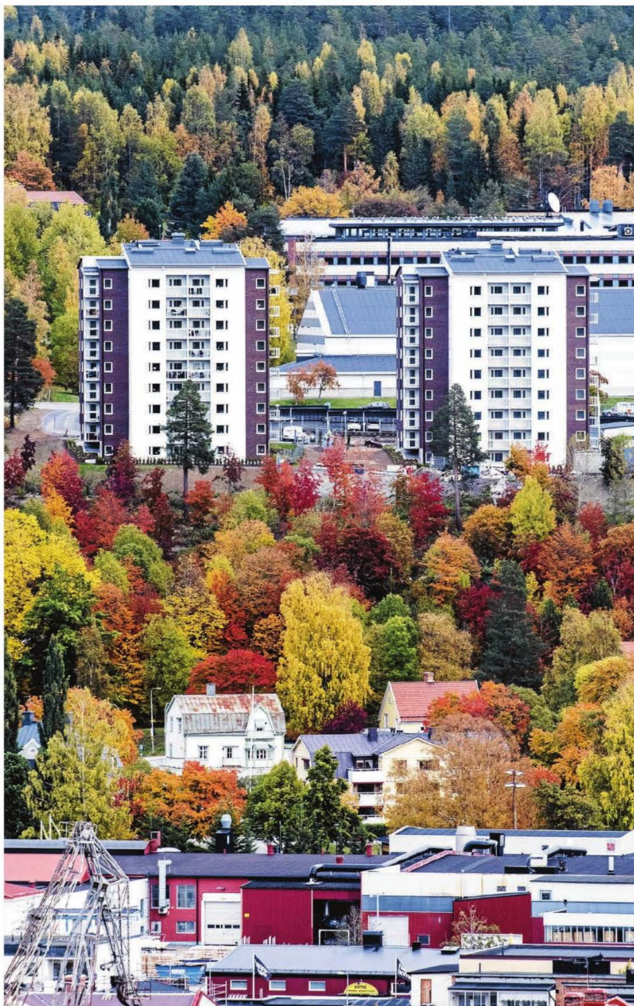
Första huset är klart uppe vid gamla Folkets Park. Om en månad är det dags för inflyttning i hus nummer två.

www.facebook.com/allehandamedia www.twitter.com/Allehanda_se