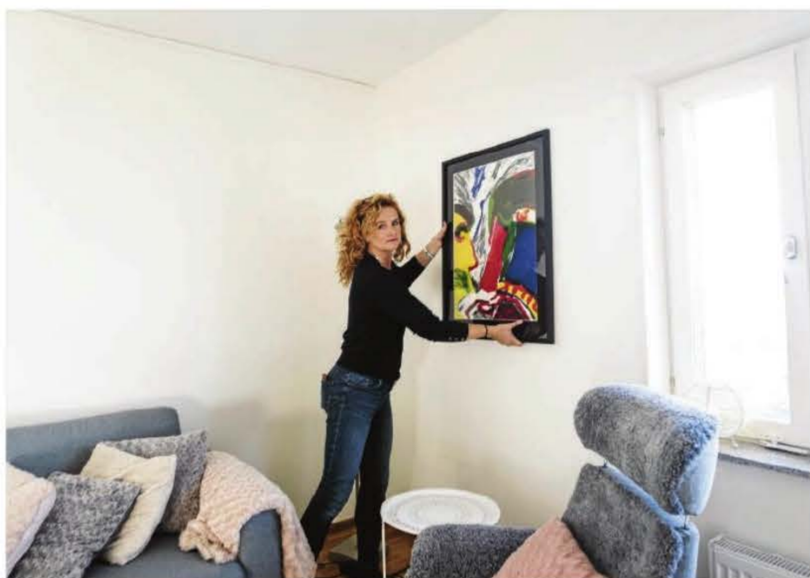
Bland annat återstår att hänga upp tavlor. "Vad blir bäst? Ska den få hänga här eller där?"