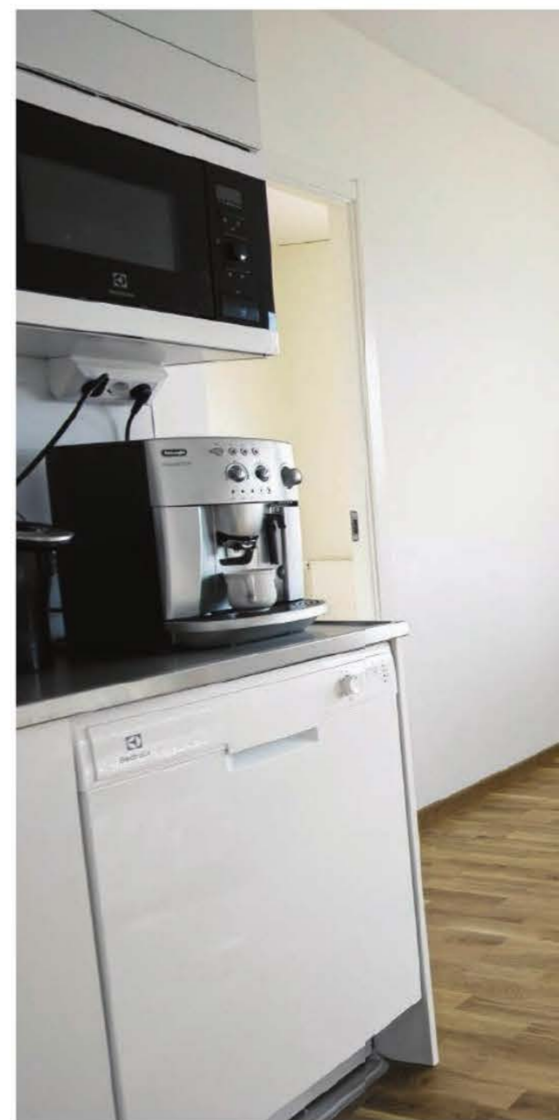
Alla möbler är inte på plats ännu.