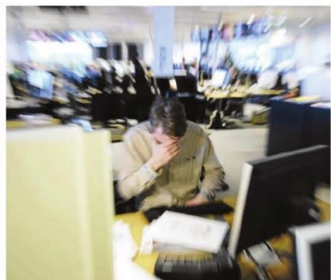
Att arbeta i offentlig verksamhet kan vara stressigt. Det är också den kategori av yrken som orsakar förhållandevis flest arbetssjukdomar.